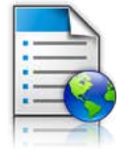
Formulär och favoriter

Bildskärmsanpassning: Visa ett anpassat, bläddringsbart bildspel på färgpekskärmen om du vill berätta något viktigt för användarna när skrivaren är i energisparläget.