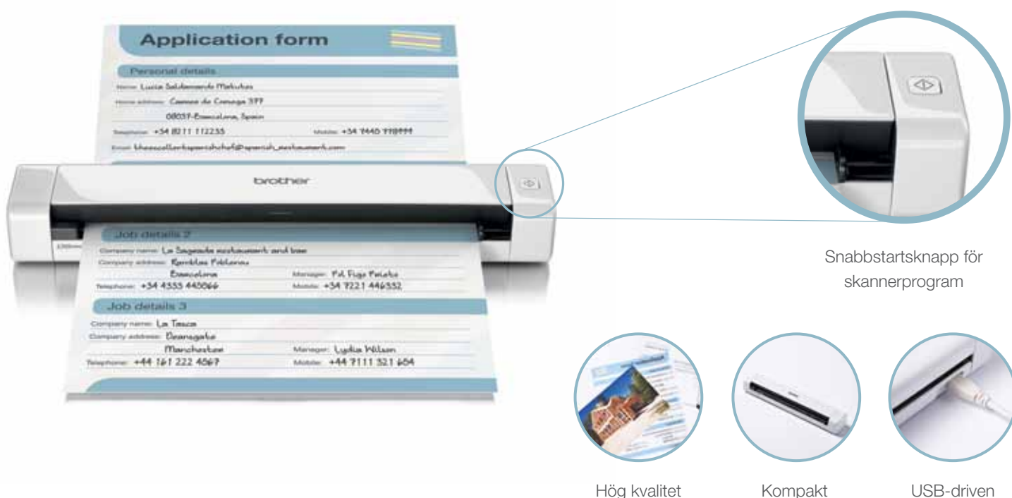
Snabbstartsknapp för skannerprogram

DS-620 skannar alla dina dokument (inklusive ID-kort av plast och kvitton) och gör dem klara att sparas i molnet. Du kan även visa dokumenten på din mobila enhet och därmed alltid ha informationen till hands.